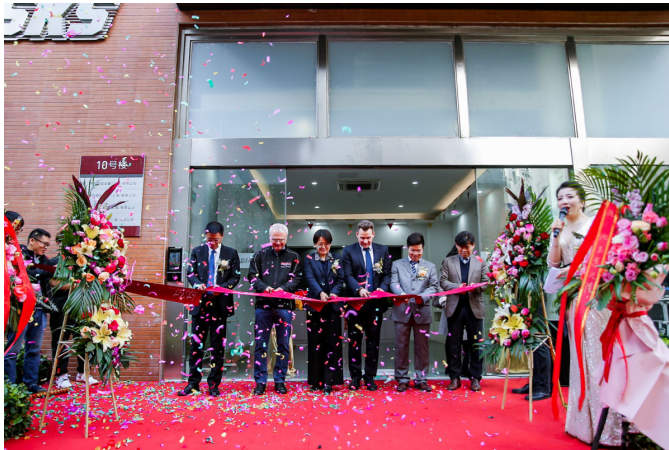
1: Offizielle Eröffnung der neuen Räumlichkeiten